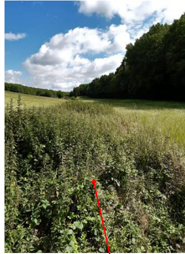
Localisation et vue du tronçon de Fontaine