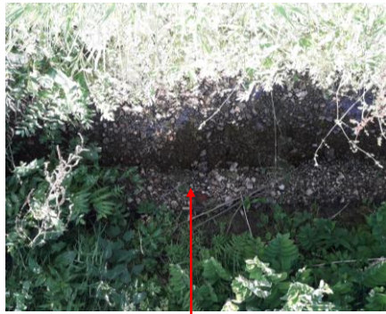
Localisation et vue du trouçon du Puits