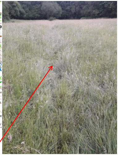
Localisation et vue de l'écoulement expertisé